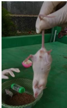
Gambar 3. Defisit Neurologis pada Mencit

Pada penelitian ini, ekstrak etanol rimpang lengkuas digunakan sebagai sumber antioksidan. Antioksidan penting yang terkandung dalam lengkuas antara lain flavonoid dan melatonin. Nantinya flavonoid akan menetralkan ROS dengan cara mendonorkan satu ion hidrogennya. Sementara melatonin akan mengurangi respon inflamasi dan menurunkan permeabilitas vaskuler (termasuk sawar darah otak). [19,20]